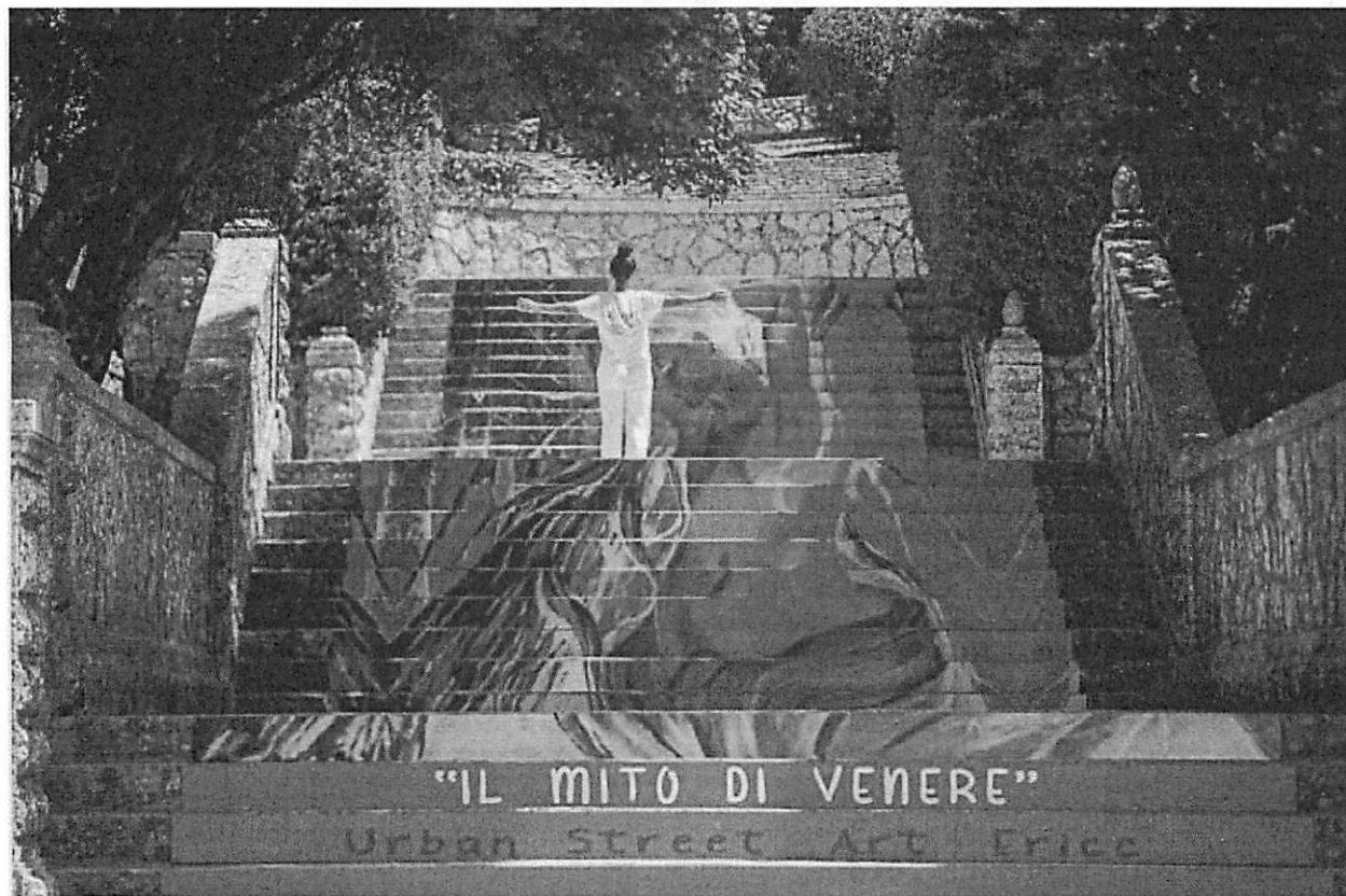
Erice. Il mito di Venere- scalinata ai giardini del balio. 2019

Eventuali allegati: foto, presentazioni, materiali in formato digitale, etc. (elenco) Esempi di Stair Street Art, l'arte di dipingere e decorare le scale