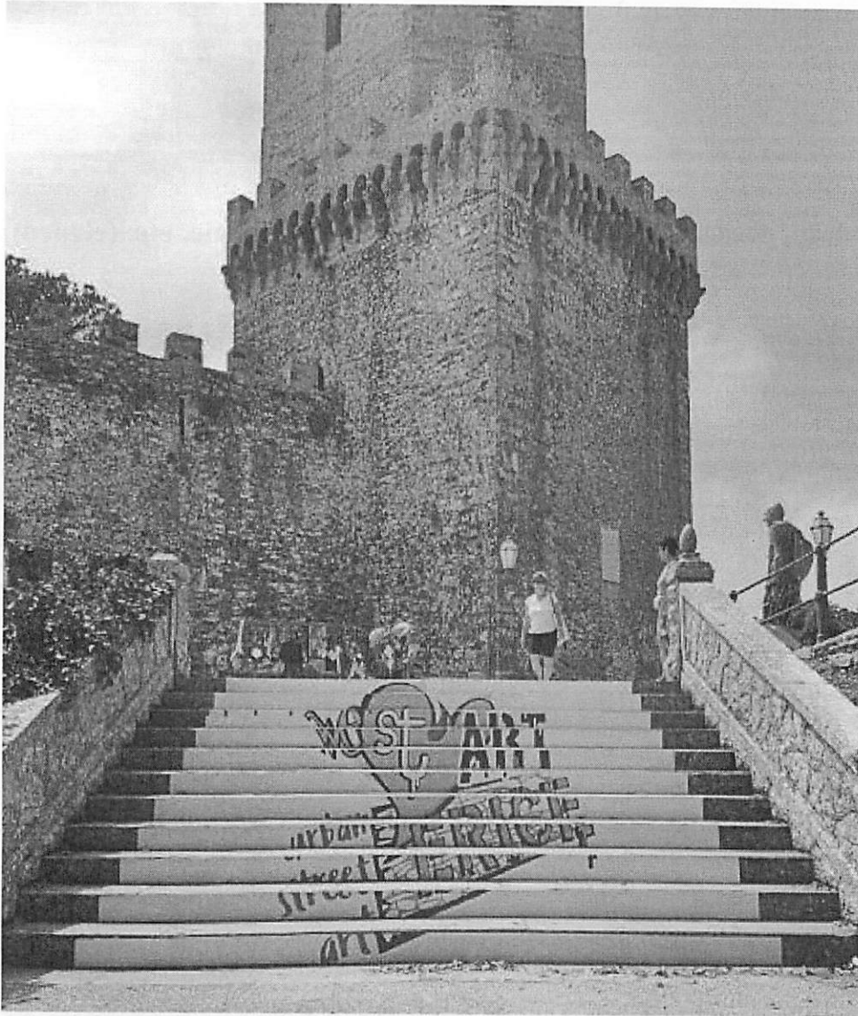
Piazza Pertini. Valderice .2014